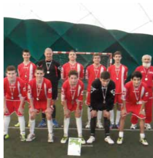
A Nikola Tesla Szerb Gimnázium labdarúgói