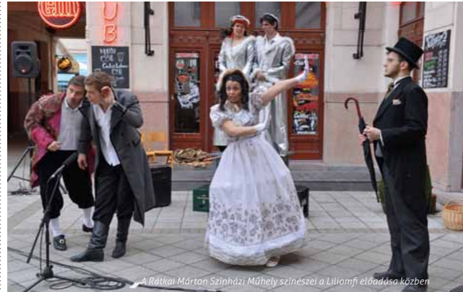
A Rátkai Márton Színházi Műhely színészei a Liliomfi előadása közben

Március 21-én az országos program nyitórendezvényeként tartották meg a Szívünk Erzsébetváros Fesztiválnapokat a Gózsdu-udvarban, amely VII. kerületi civil kezdeményezés-ként az önkormányzat támogatásával valósult meg. A megnyitón beszédet mondott Wichmann Tamás főszervező, az Euromart Közhasznú Egyesület részéről, valamint Vattamány Zsolt, Erzsébetváros polgármestere. Az esemény díszvendége egy korabeli ruhába öltözött Sisi királyné és udvarhölgyei voltak, akik a fesztivál állandó vendégeiként később is részt vettek az aktuális programokon. Az érdeklődőket a Rátkai Márton Színházi Műhely művészei szórakoztatták szabadtéri Liliomfi-előadásukkal, majd a látogatók megtekinthették az Erzsébetváros Anno című helytörténeti képeslap-kiállítást