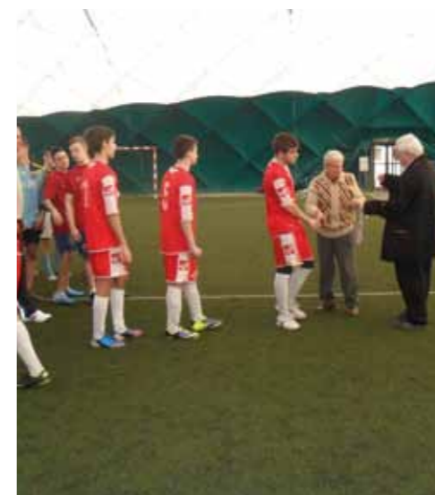
A „sasoknak” átadják az ezüstérmeket a zárőünnepségen