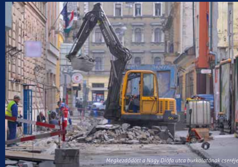
Megkezdődött a Nagy Diófa utca burkolatának cseréje

Az Erzsébet Terv részeként megvalósuló útfelújítások 2014-ben is folytatódnak: a Kertész és Hársfa utca mellett márciusban megkezdődött a Nagy Diófa utca felújítása is. A rekonstrukció a Dohány utca–Klauzál tér közötti szakaszt érinti, a Dohány utca felől haladva a Klauzál tér felé. A munkálatok során kicserélik a teljes út- és járdaburkolatot, majd új aszfaltréteget kap az úttest. A járdák öntött aszfaltból készülnek, a gyalogátkelőhelyeknél pedig speciális burkolati felület segíti majd a gyengénlátók közlekedését. Új utcabútorokat és planténereket is kihelyeznek a közterületre, mellyel zölddebbé, otthonosabbá válik a belső-erzsébetvárosi utca.