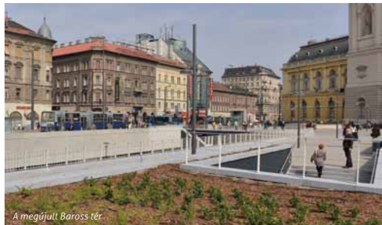
A megújult Baross tér

A 4-es metró a többi metróvonalhoz hasonlóan csúcsidőszakban 2–3 percnként, míg napközben és hétvégén 5, késő este pedig 10 percnként jár, átszállási lehetőséget biztosít a Keleti pályaudvarnál az M2-es, a Kálvin téren pedig az M3-as metróvonalra. Orbán Viktor, Magyarország miniszterelnöke az átadón gratulált Tarlós Istvánnak és munkatársainak az elvégzett munkához, valamint köszönetet mondott annak a mintegy 5000 embernek is, akik ezen a rendkívüli beruházáson dolgoztak.