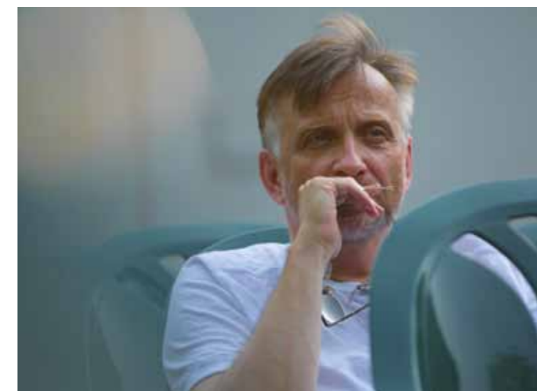
Erzsébetváros 2014. április 10.

Úgy van ez a színházban – de nyilván mindenütt –, hogy ha az ember belép egy új szobába, ahová vágyott, mindig talál egy ajtót, ami az ismeretlenbe nyílik, és mindig ez az ajtó lesz a legizgalmasabb. Ameddig most ellátok, azt érzem, hogy égető szükségünk van egy kisebb játszóhelyre, egy stúdiószínpadra, és nagyon szeretnék önálló helyet az IRAM-nak, az Örkény Színház ifjúsági programjának. Ez a két kis új hely meglódíthatná a fantáziánkat, és nagyon kitérgethetné a lehetőségeinket, a repertoár és a színészi munka terén is.