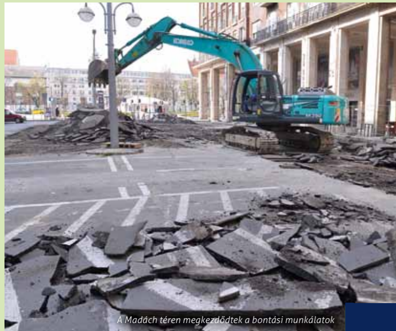
A Madách téren megkezdődtek a bontási munkálatok

Megkezdődtek a Madách tér felújítási munkálatai. A kiürített területet a kivitelezők átvették, majd első lépésben elkerítették a forgalomtól. A beruházás meghatározza Erzsébetváros arculatát, éppen ezért a lakosság döntése alapján, a kerületiek igényeit szem előtt tartva újul meg a terület.