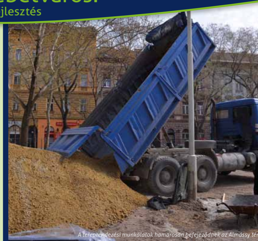
A tereprendezési munkálatok hamarosan befejeződnek az Almássy téren

Az Erzsébet Terv részeként megvalósuló útfelújítások 2014-ben is folytatódnak: a Kertész és Hársfa utca mellett márciusban megkezdődött a Nagy Diófa utca felújítása is. A rekonstrukció a Dohány utca–Klauzál tér közötti szakaszt érinti, a Dohány utca felől haladva a Klauzál tér felé. A munkálatok során kicserélik a teljes út- és járdaburkolatot, majd új aszfaltréteget kap az úttest. A járdák öntött aszfaltból készülnek, a gyalogátkelőhelyeknél pedig speciális burkolati felület segíti majd a gyengénlátók közlekedését. Új utcabútorokat és planténereket is kihelyeznek a közterületre, mellyel zölddebbé, otthonosabbá válik a belső-erzsébetvárosi utca.